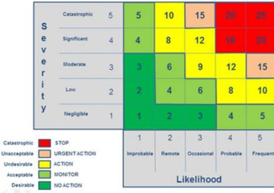
A fairly standard version of a Risk matrix – the foundation of the other Axis for a CSR Materiality Matrix

Ziel ist es die rot gekennzeichneten Risiken in den gelben Bereich zu bringen, und die gelben in den grünen Bereich.