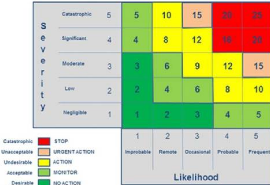
A fairly standard version of a Risk matrix – the foundation of the other Axis for a CSR Materiality Matrix

Ziel ist es die rot gekennzeichneten Risiken in den gelben Bereich zu bringen, und die gelben in den grünen Bereich.