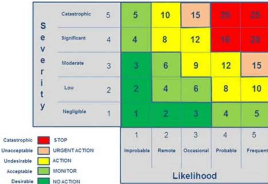
A fairly standard version of a Risk matrix – the foundation of the other Axis for a CSR Materiality Matrix

Ziel ist es die rot gekennzeichneten Risiken in den gelben Bereich zu bringen, und die gelben in den grünen Bereich.