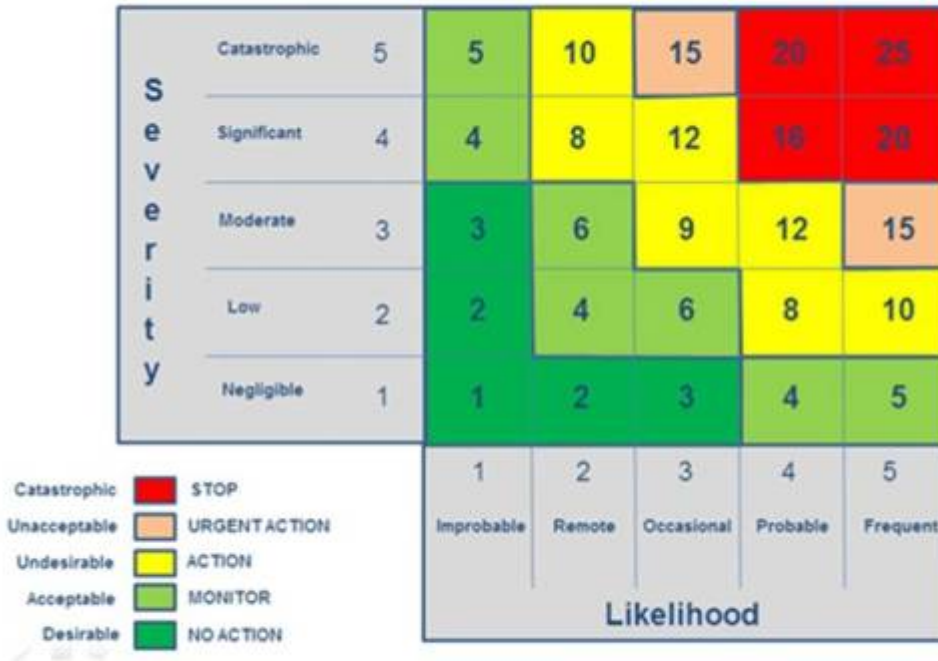
A fairly standard version of a Risk matrix – the foundation of the other Axis for a CSR Materiality Matrix

Ziel ist es die rot gekennzeichneten Risiken in den gelben Bereich zu bringen, und die gelben in den grünen Bereich.