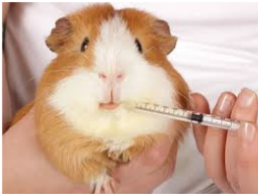
Abbildung 1: Tierarzt ...

Welcher Tierarzt in Frage kommt, hängt von folgenden Faktoren ab: