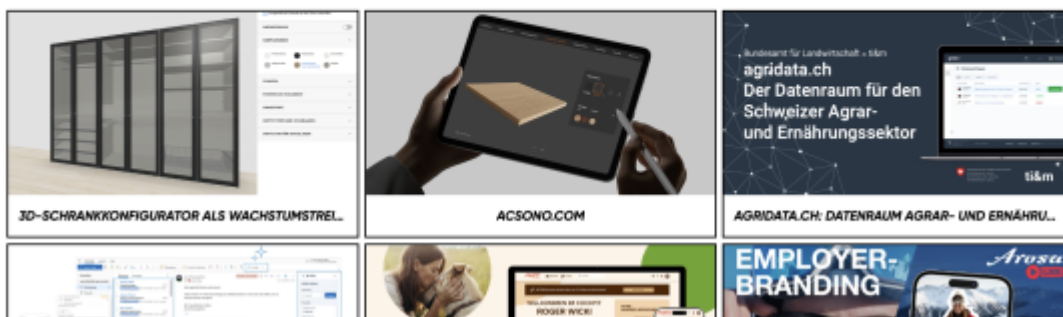
Screenshot bestofswissweb.swiss - Hall of Fame