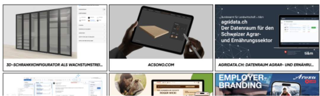
Screenshot bestofswissweb.swiss - Hall of Fame