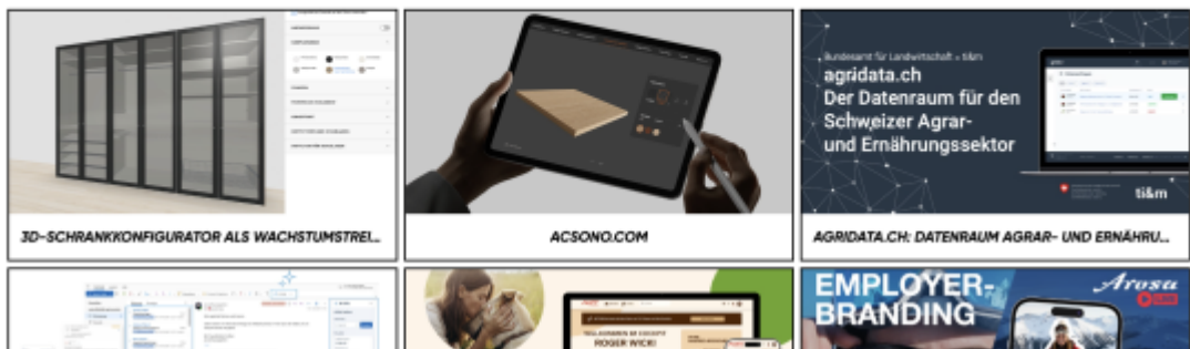
Screenshot bestofswissweb.swiss - Hall of Fame