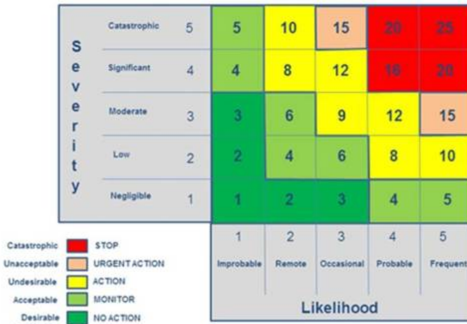
A fairly standard version of a Risk matrix – the foundation of the other Axis for a CSR Materiality Matrix

Ziel ist es die rot gekennzeichneten Risiken in den gelben Bereich zu bringen, und die gelben in den grünen Bereich.