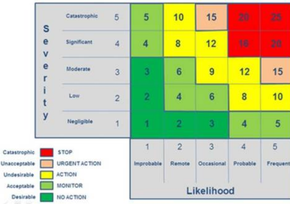
A fairly standard version of a Risk matrix – the foundation of the other Axis for a CSR Materiality Matrix

Ziel ist es die rot gekennzeichneten Risiken in den gelben Bereich zu bringen, und die gelben in den grünen Bereich.