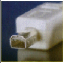
Mini-B-Stecker von Mitsumi (z. B. für Digitalkameras)