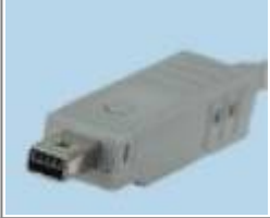
Mini-B-Stecker von Fuji (z. B. für Digitalkameras)

From: https://wiki.bzz.ch/ - BZZ - Modulwiki