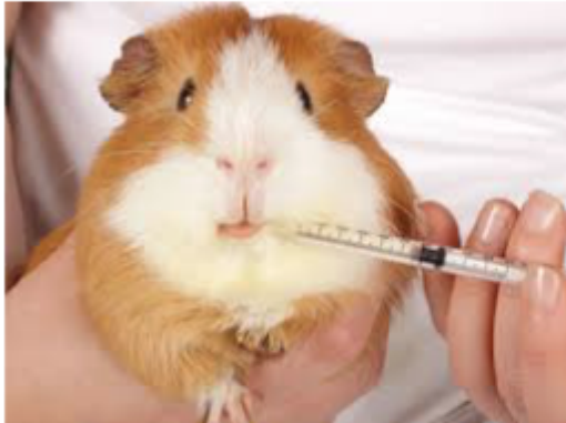
Abbildung 1: Tierarzt ...

Welcher Tierarzt in Frage kommt, hängt von folgenden Faktoren ab: