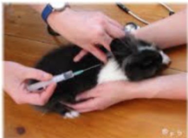
Abbildung 1: Impfung ...