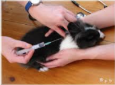
Abbildung 1: Impfung ...