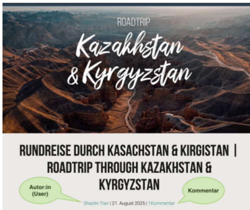
Screenshot: Einzelansicht eines Blog-