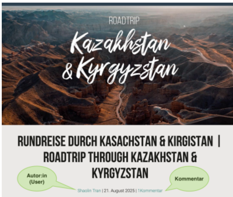
Screenshot: Einzelansicht eines Blog-