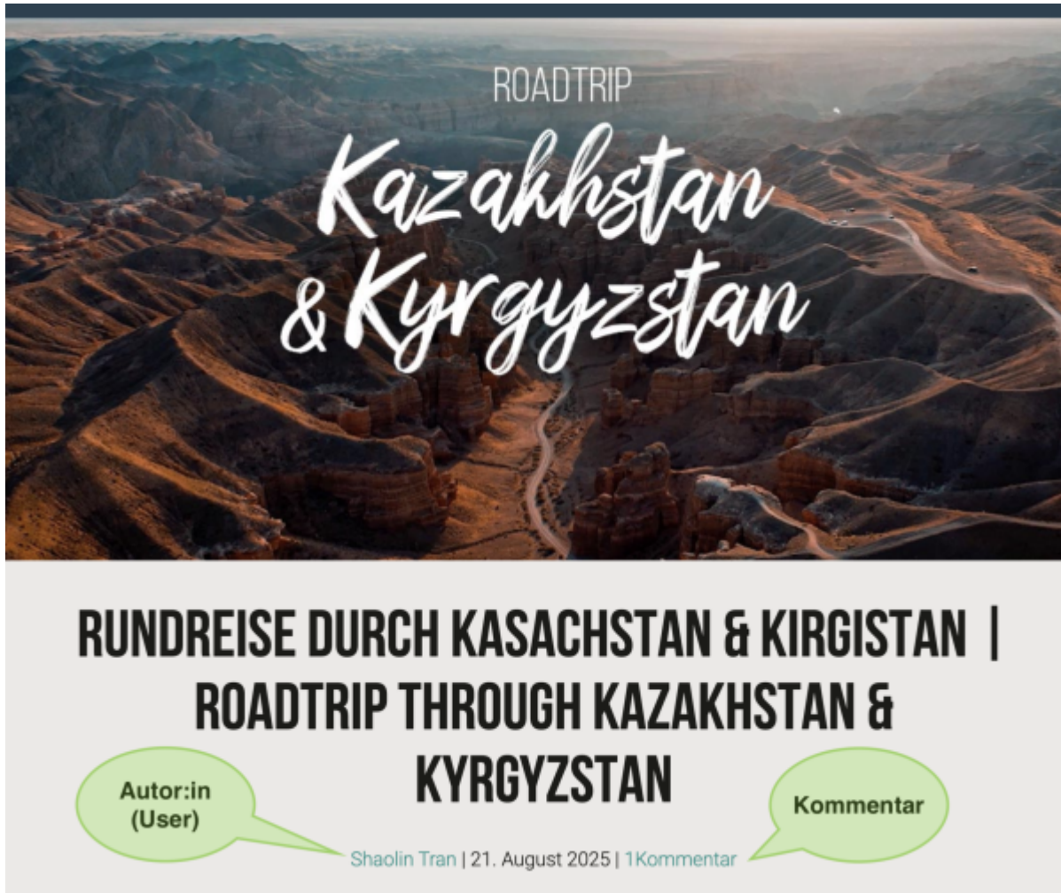
Screenshot: Einzelansicht eines Blog-Posts.