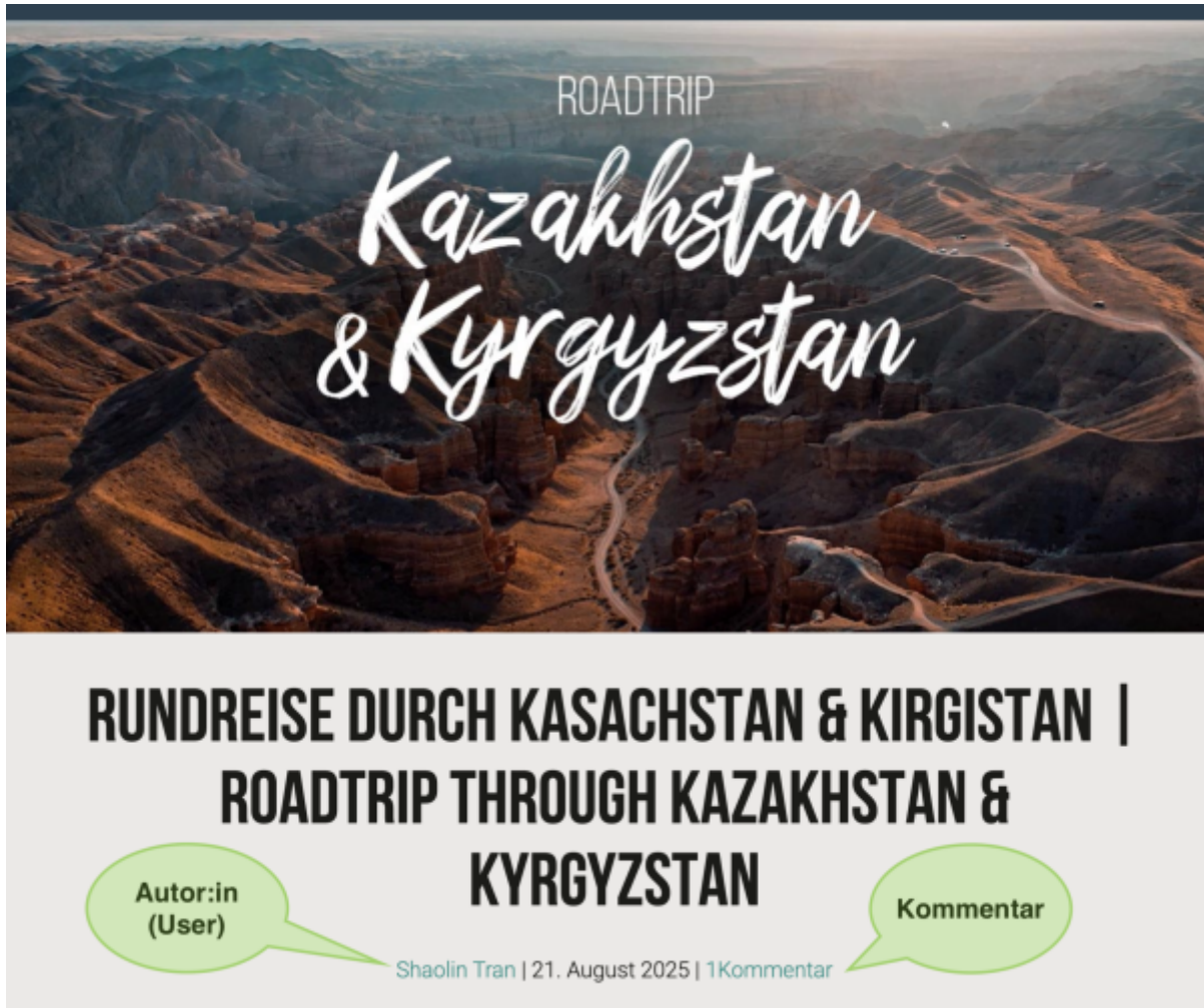
Screenshot: Einzelansicht eines Blog-Posts.