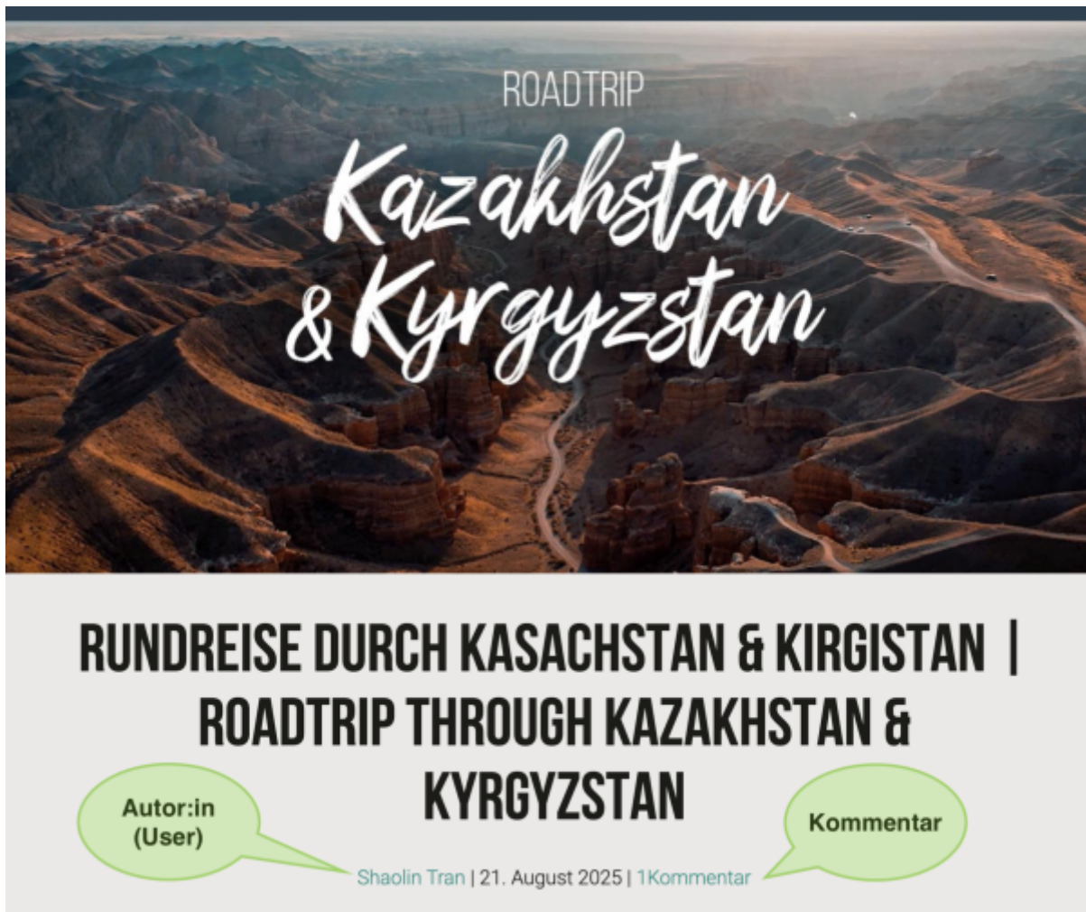
Screenshot: Einzelansicht eines Blog-Posts.