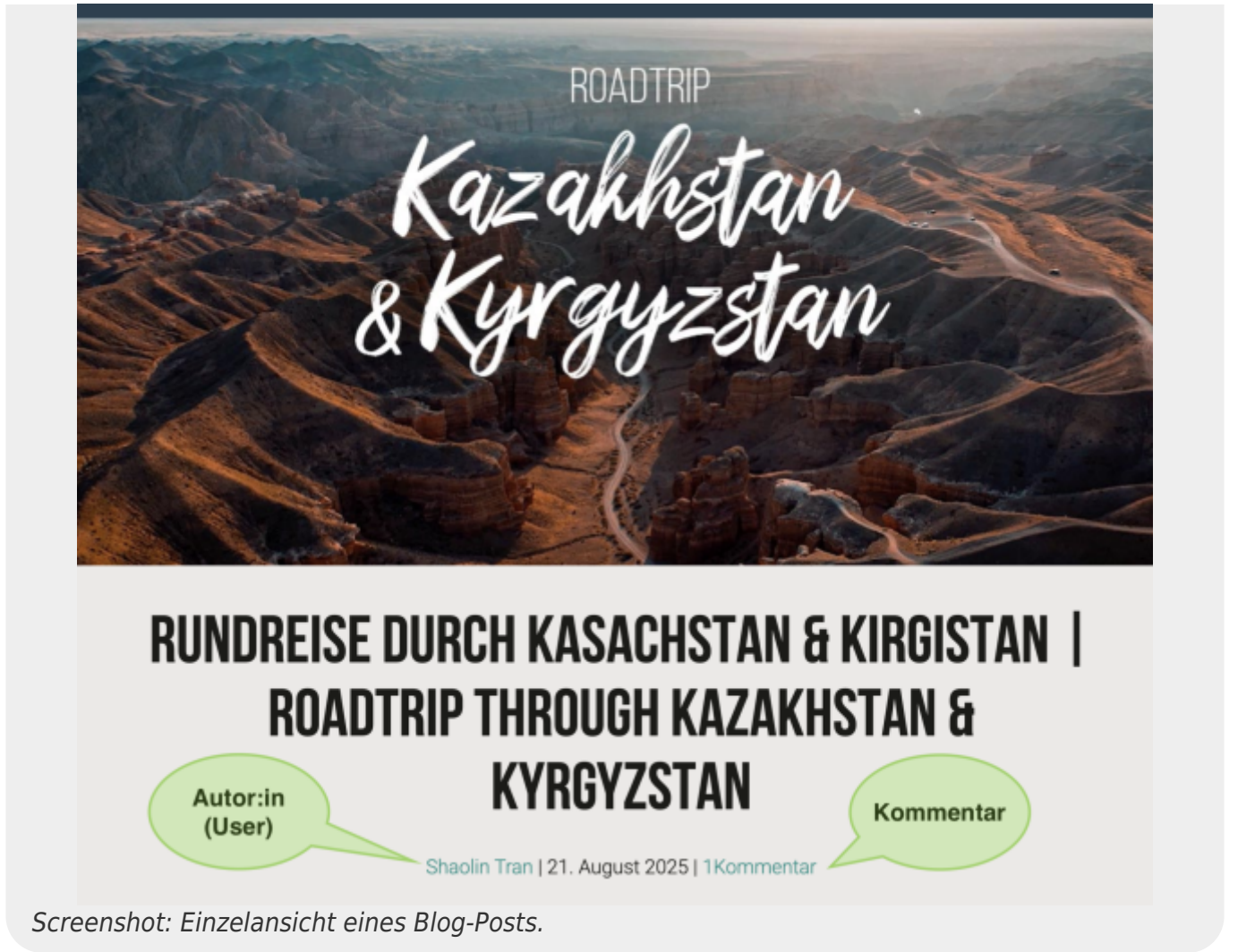
Screenshot: Einzelansicht eines Blog-Posts.