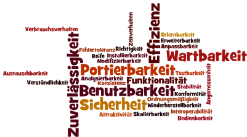
Abb-1: Erwartungen des Kunden an der Software-Qualität

Was kann der Kunde erwarten, wenn er Ihnen eine Software (z.B. Webblog oder ein CMS inkl. Styling, JavaScript, PHP und Datenbank) in Auftrag gibt?