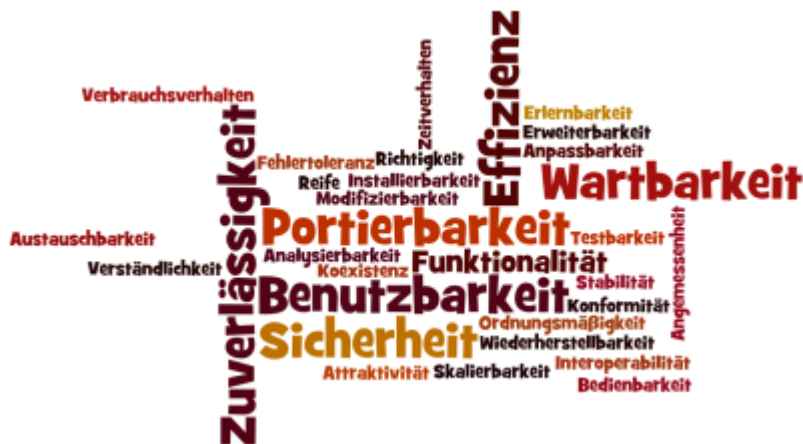
Abb-1: Erwartungen des Kunden an der Software-Qualität

Was kann der Kunde erwarten, wenn er Ihnen eine Software (z.B. Webblog oder ein CMS inkl. Styling, JavaScript, PHP und Datenbank) in Auftrag gibt?