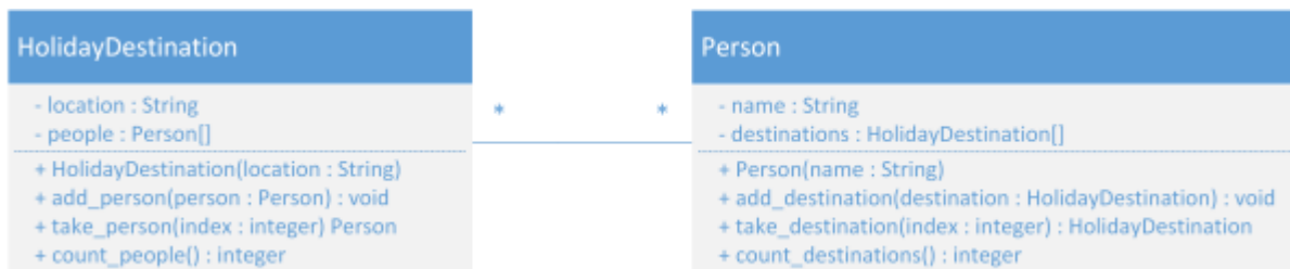
Abb: n:n Beziehung