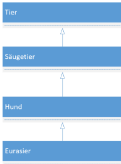
Abb 6.8: Spezialisierung einer Klasse

Für die Klasse Eurasier gilt die Aussage: